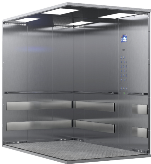
ДЛЯ МЕДИЦИНСКИХ УЧРЕЖДЕНИЙ